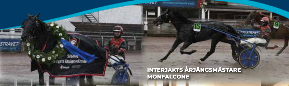
INTERJAKTS ÅRJÄNGSMÄSTARE MONFALCONE