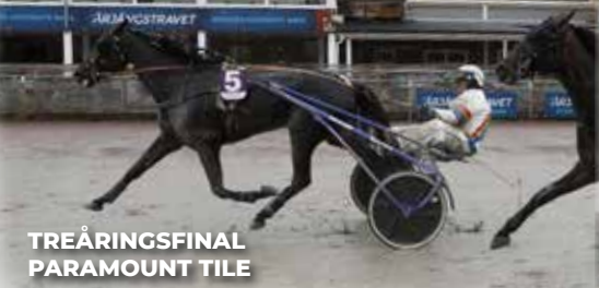
TREÅRINGSFINAL PARAMOUNT TILE