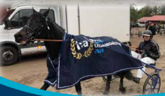
SVEAS KALLBLODSMÄSTARE ÅSRUD VILJA

PUBLIKFRITT TISDAG 20 OKTOBER FÖRSTA START 12.20